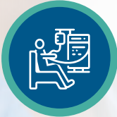
غسيل الكلى في المنزل