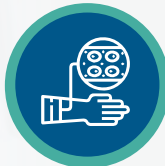
العلاج عن طريق الحقن