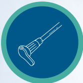
العلاج الغذائي والتغذية الأنبوية