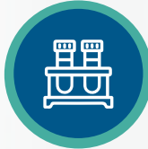
جمع عينات الدم