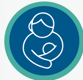
رعاية الأم والطفل

وبالإضافة إلى ذلك، لقد عقدنا شراكة مع بعض المستشفيات الكبرى لتقديم الخدمات المذكورة أعلاه.