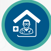
استشارة الطبيب في المنزل