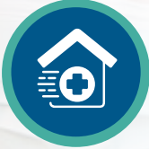
العلاج الطبيعي المنزلي

نضيف باستمرار المزيد من الخدمات، ولكن خدماتنا الأساسية مدرجة هنا