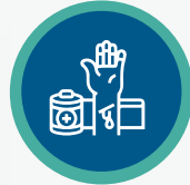
إدارة العناية بالجروح